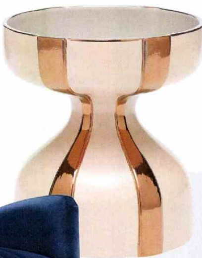
Delicado y sofisticado , el jarrón Evita, de la serie Ladies Collection, es obra de Joana Virgolino para Byfly . En cerámica y cobre (150€).

LOS ACABADOS SOFISTICADOS Y LOS TONOS ROSAS, DORADOS Y AZULES SON LOS TRIUNFADORES DE ESTA EDICIÓN