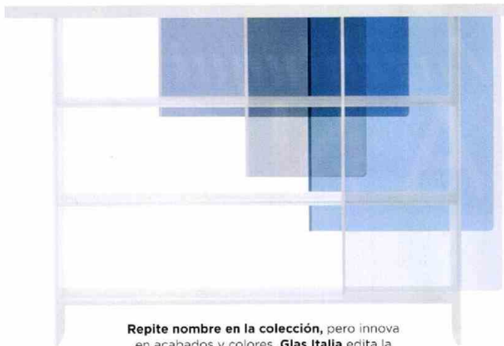
Repite nombre en la colección, pero innova en acabados y colores. Glas Italia edita la estantería Layers (5.353€) de Nendo.

Revolucionar la cocina es la propuesta de Knindustrie . Para ello la surte de piezas de cerámica y madera en tonos sugerentes.