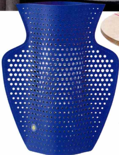
Azul cobalto , el color que pronto veremos en todas las casas, es el elegido para el jarrón Helio que firma Octaevo (unos 25€).