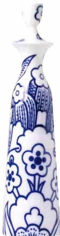
Arte en porcelana, así se presenta la colección Objects to a Muse, de Sieger by Fürstenberg . Este es el jarrón Charlotte (332 cm; 429€).