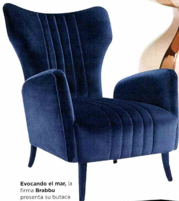
Evocando el mar , la firma Brabbu presenta su butaca Davis con tapicería de terciopelo (2.030€); una propuesta sofisticada y contemporánea.

LOS ACABADOS SOFISTICADOS Y LOS TONOS ROSAS, DORADOS Y AZULES SON LOS TRIUNFADORES DE ESTA EDICIÓN