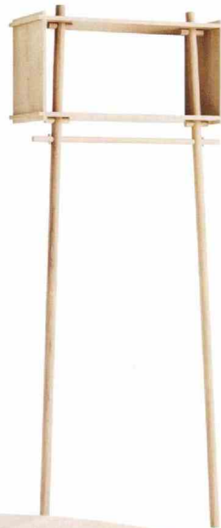
Compacto y de roble, así se da a conocer Tøjbox , una solución apta para el dormitorio o el closet, para almacenar o colgar tu ropa. De Woud (CPV).