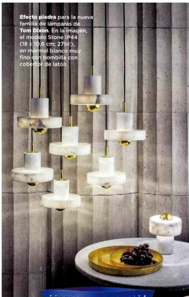
Efecto piedra para la nueva familia de lámparas de Tom Dixon . En la imagen, el modelo Stone IP44 (18 x 10,6 cm; 275€), en mármol blanco muy fino con bombilla con cobertor de latón.