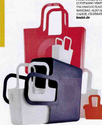
KOZIOL DESIGN ALESSANDRO MENDINI & MARIA CRISTINA HAMEL TASCHE. LA FAMOSA BORSA IN PLASTICA, ANCHE FORZA-OGGETTI, COME QUESTANNO VENTANNI. THE FAMOUS PLASTIC HANDBAG, ALSO AN OBJECT CALDER, CELEBRATES ITS 20TH. koziol.de