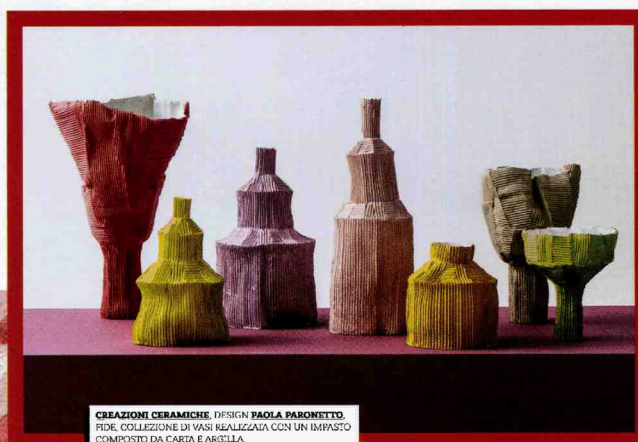
CREAZIONI CERAMICHE DESIGN PAOLA PARONETTO . FIDE. COLLEZIONE DI VASI REALIZZATA CON UN IMPASTO COMPOSTO DA CARTA E ARGILLA. COLLECTION OF VASES MADE WITH A MIXTURE OF PAPER AND CLAY. paola-paronetto.com