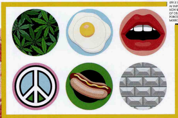
SELLETTI DESIGN STUDIO JOB BLOW. NUOVI MARCHIO E AL CONTEMPO. NUOVA COLLEZIONE D'OGGETTI IN STILE POP, DAI PIATTI IN PORCELLANA AI DAPPETI, AGLI SPECCHI. NEW BRAND AND NEW COLLECTION OF OBJECTS IN POP STYLE, FROM PORCELAIN PLATES TO RUGS TO MIRRORS. selletti.it