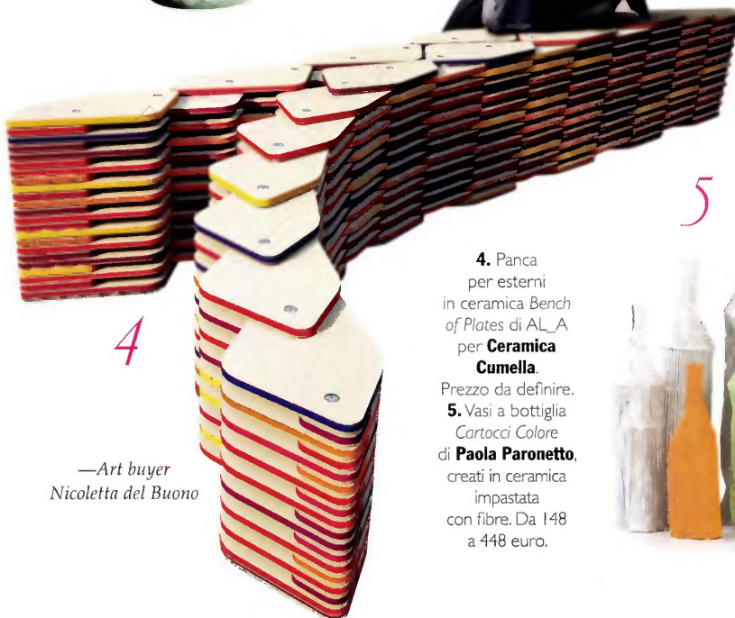
—Art buyer Nicoletta del Buono