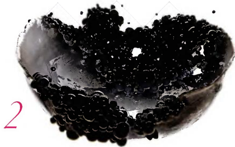
2. In ceramica sfaccettata, questo vaso con calotta fa parte della collezione "Dusty Diamonds" della svedese Anna Elzer Oscarson . Da 167 a 887 euro. 2. Ciotola-scultura in ceramica Proliferazione in nero di Francesco Ardini . Prezzo da definire.