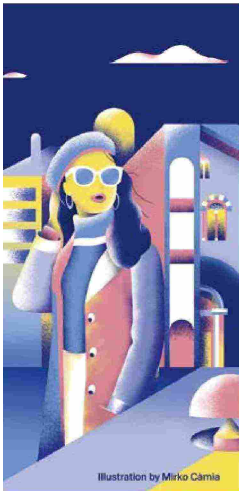
Illustration by Mirko Càmia