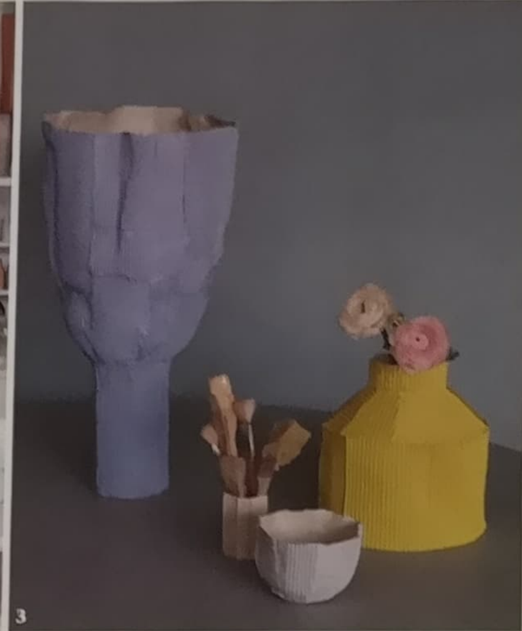
1. In primo piano la ciotola Ring, dietro i vasi Anemone, Cactus e Vesuvio. 2. Paola Paronetto con un collaboratore nell'atelier di Porcia, vicino a Pordenone. 3. Il vaso Tulipano alto 65 cm; il piccolo vaso Mono con i pennelli; il vaso Fide e la ciotola Cartoccio. 4. Uno scorcio dell'atelier. 5. Composizione di vasi Mono e Fide.